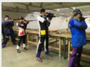
Klein- & Großkaliber