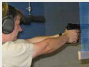
Pistole & Revolver