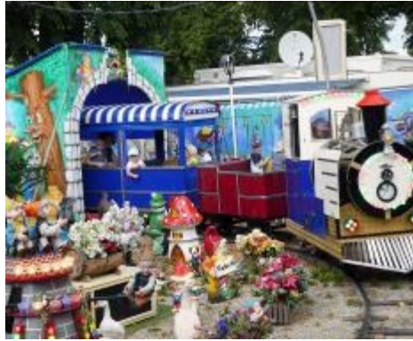
Der Schaustellerkönig ist Lokomotivführer