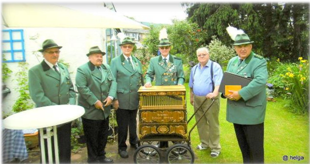
Bild von links: