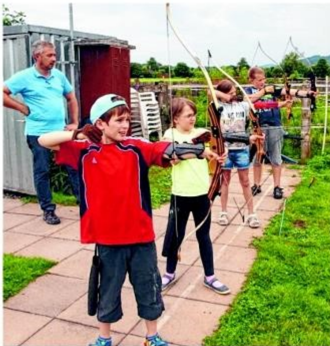
Während der vordere Schütze bereits den Pfeil abgeschossen hat, haben die anderen drei Jugendlichen noch den Bogen gespannt und zielen auf die Scheibe.

Körperspannung und Konzentration beim Bogenschießen geübt