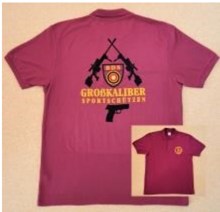
Shirt der Großkaliberschützen