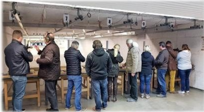
das aktiven Schießen in den 100m Ständen.

Ein Teil der ASC-Teilnehmern mit den besten Schützen bei der Siegerehrung