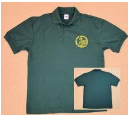
Shirt grün mit Emblem für Aufsicht usw.