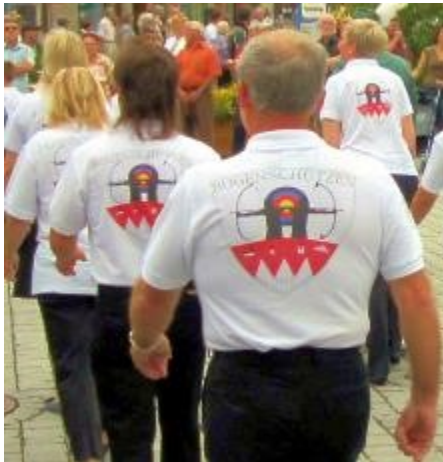
Shirt der Bogenabteilung