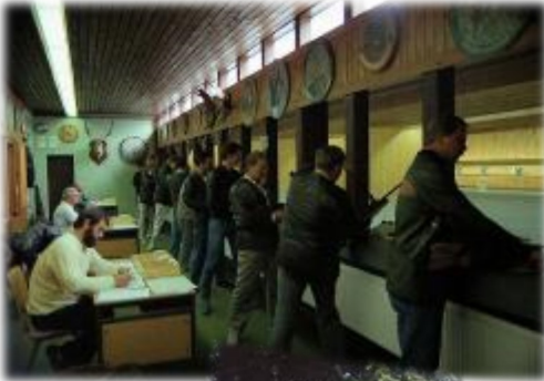
Die Luftgewehrstände am Schützenfest 1988.

Dies ist heute der Durchgang vom Schützenhaus hinter zur Schießanlage