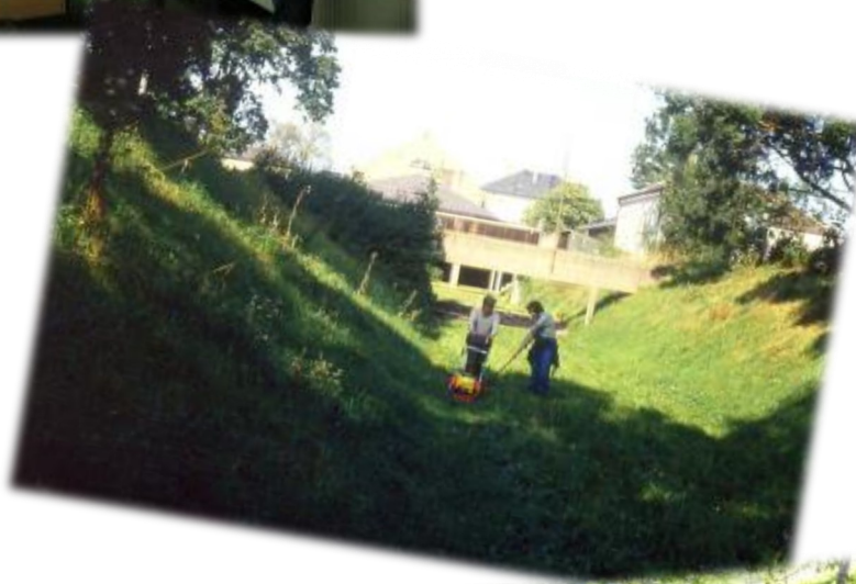
Die 50m und 100m Schießbahnen im Jahr 1987. Arbeitsdienste bestanden aus Mäharbeiten und wie unten, aus Neuerrichtung der Kugelfänge

Dies ist heute der Durchgang vom Schützenhaus hinter zur Schießanlage