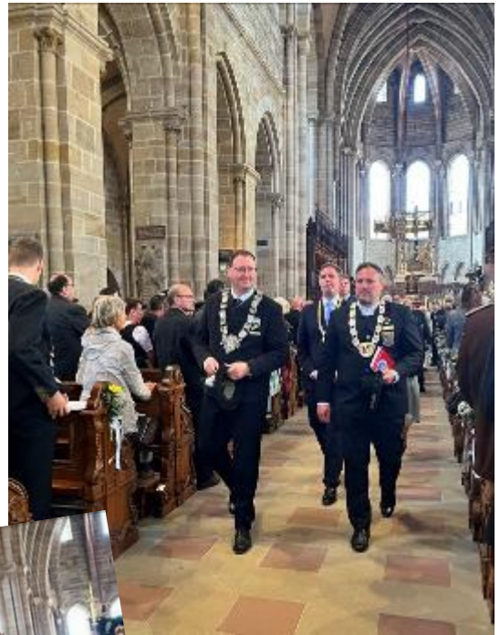
Die Ehrengäste und die Fahnen ziehen aus dem Dom