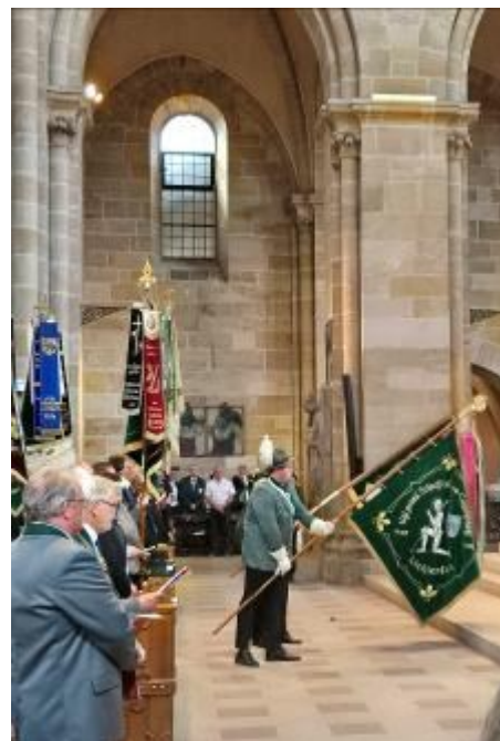
Farbenprächtiger Fahneneinzug in den Bamberger Dom