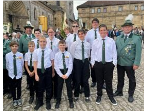
Aufstellung zum Festzug