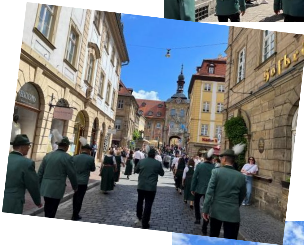
Festzug durch die Sandstraße zum Maxplatz